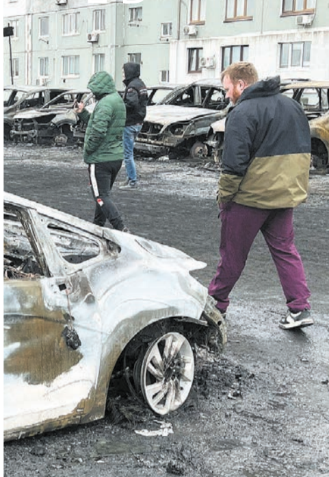
Предварительный ущерб – 67 млн рублей.