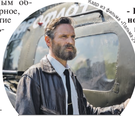
Кадр из фильма «Пальма-2»

Вообще на съемочной площадке главный - режиссер, но тут приходилось прежде всего считаться с косячатым актером.