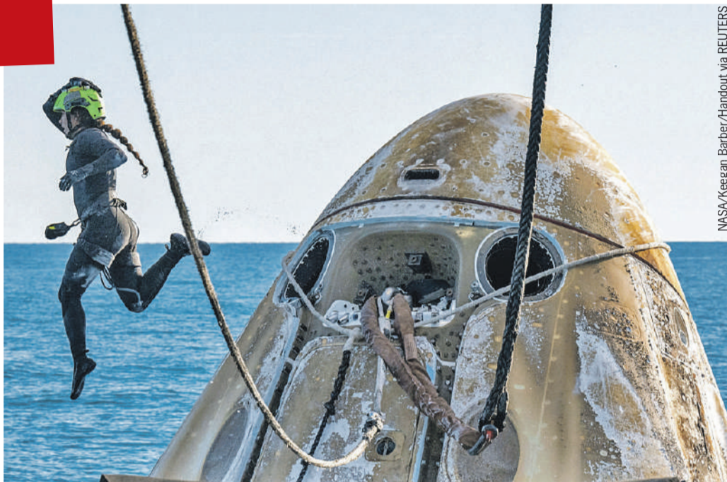
- Мы прожаримся в плазме и искупаемся в океане! - сказала перед возвращением Суни Уильямс (но в воду прыгает не она, встречающий персонал).