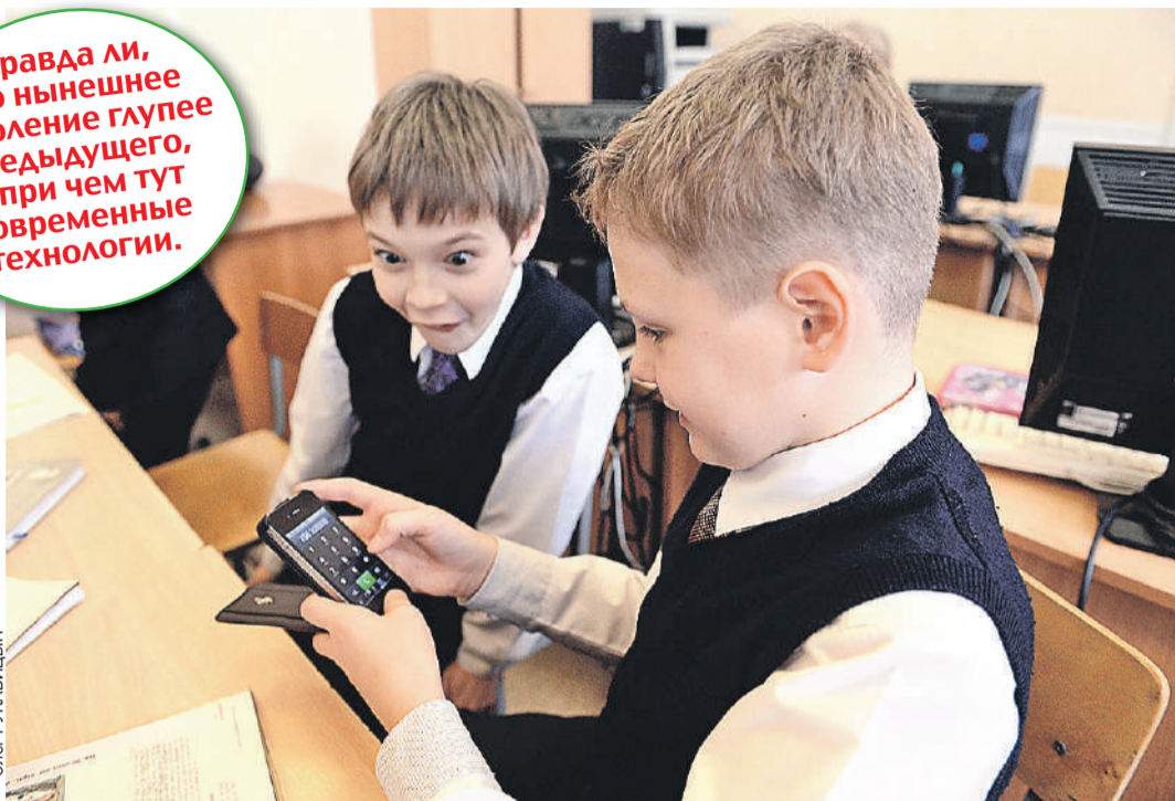
Смартфон и посчитает за школяров, и сочинение напишет. Но стоит ли сопротивляться этому?

Правда ли, что нынешнее поколение глупее предыдущего, и при чем тут современные технологии.