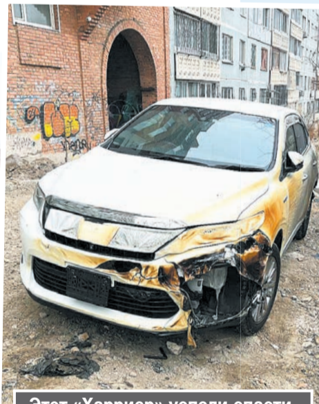
Этот «Харриер» успели спасти.

У некоторых сгорело сразу несколько автомобилей.