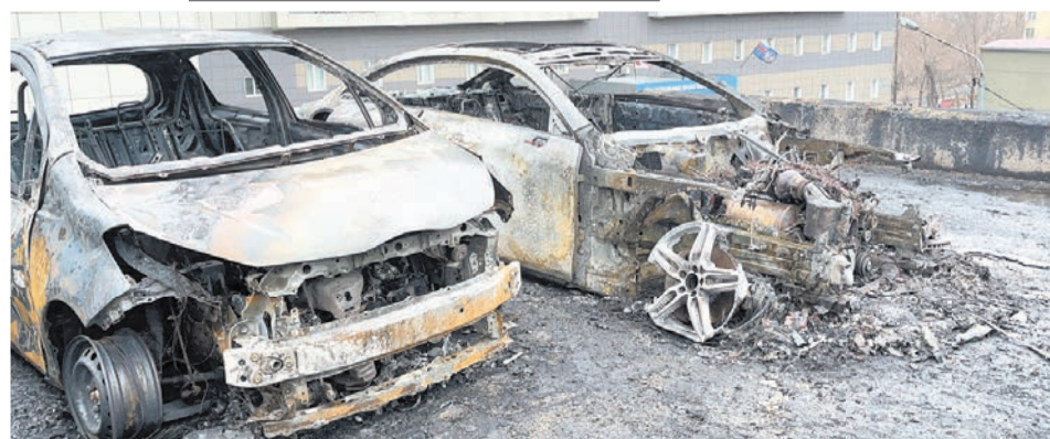
Есть и европейские марки.