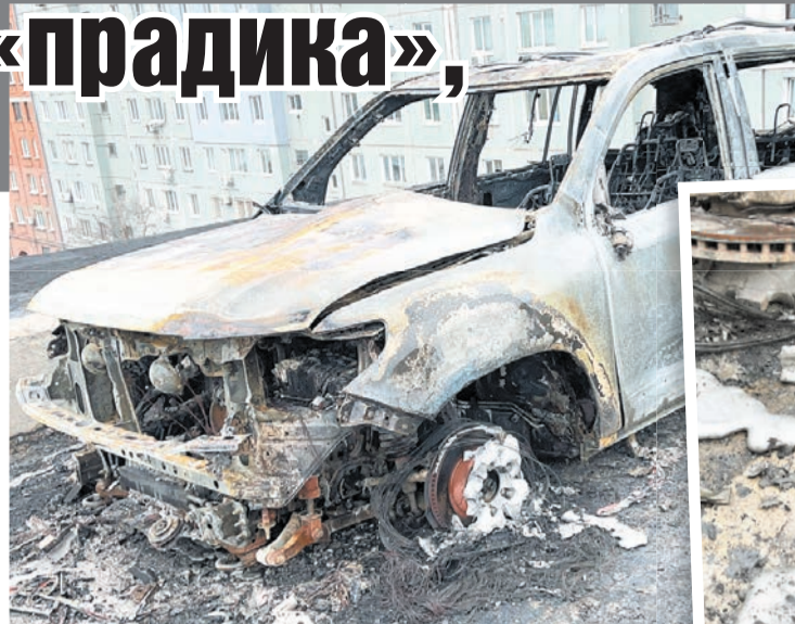
Среди сгоревших – дорогие внедорожники.

- Пожар начался с одного - по моему, это «Тойота Лэнд круизер» 200, и, возможно, он был главной целью поджигателя.