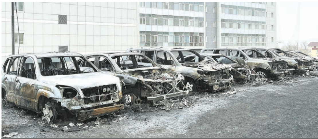
Огнем уничтожен 21 автомобиль.

Заведено уголовное дело по ч. 2 ст. 167 УК РФ (умышленное уничтожение имущества, совершенное из хулиганских побуждений, путем поджога, с причинением значительного ущерба). Идет следствие. А сами владельцы сгоревших авто обещают вознаградить тем, кто прольет свет на личность поджигателя.