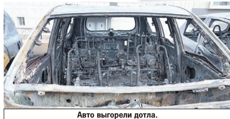
Авто выгорели дотла.

Температура была такой, что плавился металл.